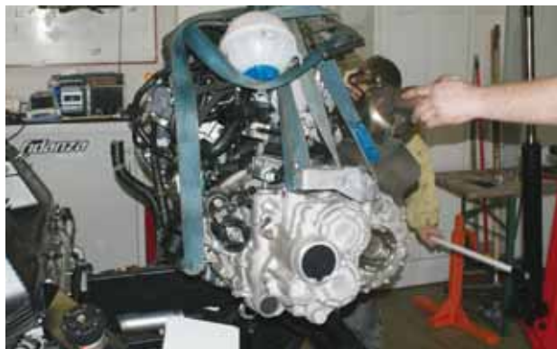
... einen S3-Motor getauscht, ein nachgeschärfter Datensatz...