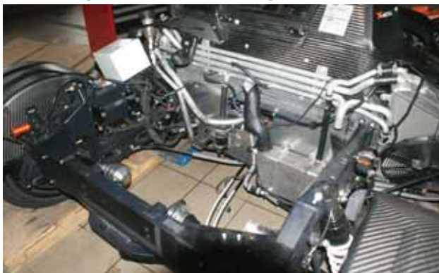
Der serienmäßige 2 Liter A3-TFSI wird gegen ...