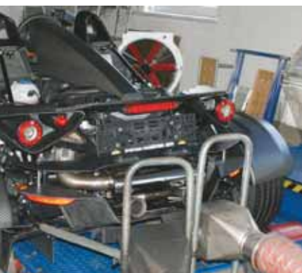
... und eine KN-Pipes Auspuffanlage vervollständigen den Umbau.

■ Fazit: Chipupdate macht aus dem heimischen Fun-car ein echtes Race-car mit dazugehörigem Racefeeling. Zum ultimativen Renner fehlen lediglich die GT4 Auspuffanlage und Slicks. Musste man Ampelspielchen am Gürtel bisher auf Kaliber eines Carrera reduzieren, so ist man jetzt